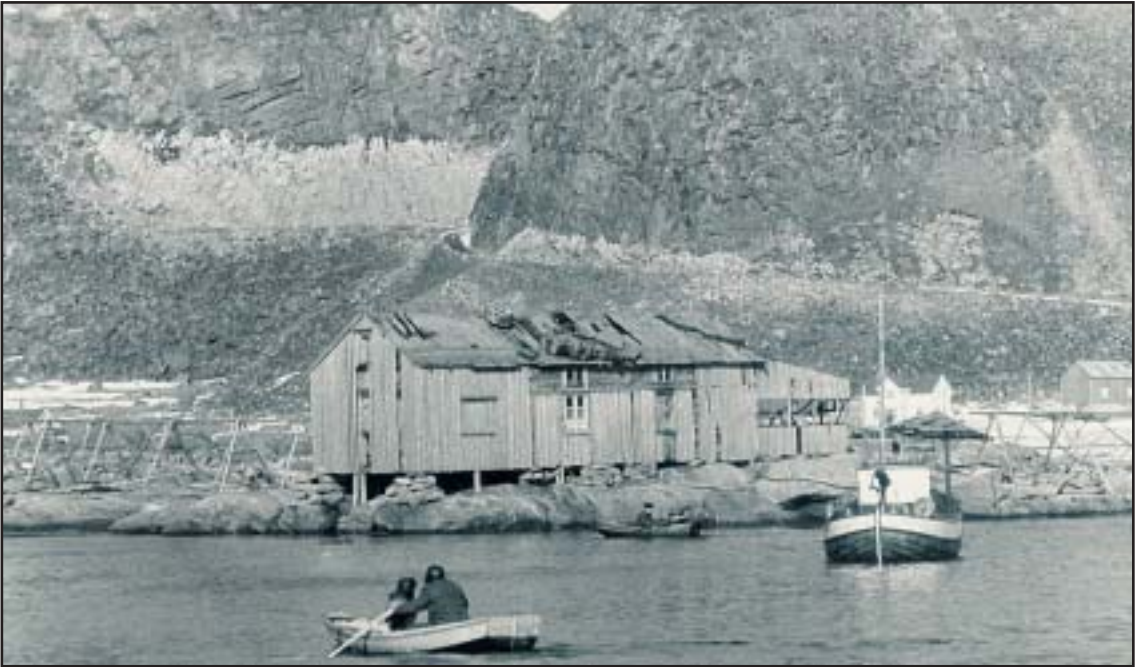
Huset på Langholmen fotografert på slutten av 1960-tallet.