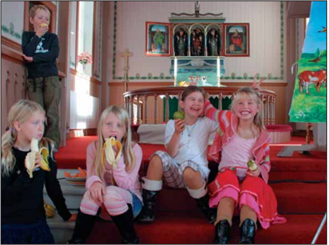
Kirkekaffen besto i at barn og voksne forsynte seg av grøden