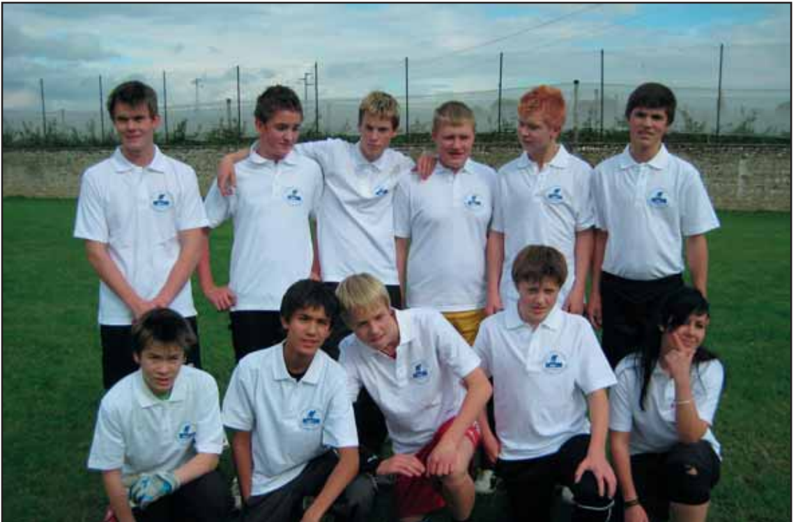
Røst klar til fotballkamp mot Sandrigo

Fire seilere fra Sandrigo kopierte Querinis ferd fra Venezia via Kreta og Flandern til Røst denne våren. S/S Mandrake II ankom Røst 7. juli etter å ha gjennomført en krevende tur nøyaktig etter planen. Båt og mannskap ble møtt av røstværingene på Sandøya til en strålende mottakelse med etterfølgende middag og folkefest. Dette skjedde det året vi markerte 575-års jubileum for Querinis brutale ankomst til Røst i 1432. 2007 er