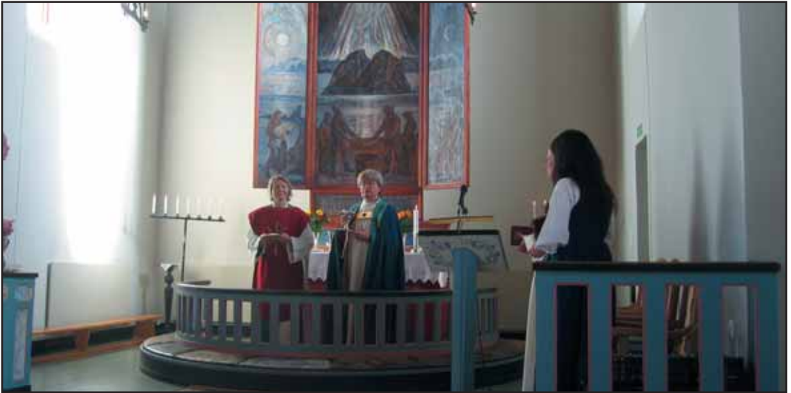
Fra visitasgudstjenesten i Værøy kirke søndag 23. september.