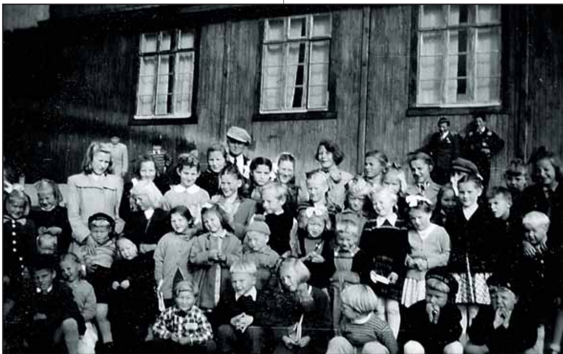
Søndagsskolen samlet utenfor "Sion". Barne- og ungdomsarbeid var en prioritert oppgave for menigheten.