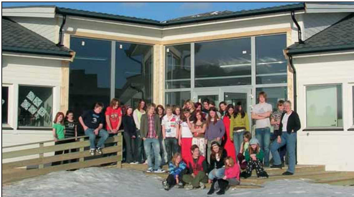
Alle Weekenddeltakerne samlet utenfor den nye skolen på Værøy

Årets Weekend var kjemp flott takket være flott ungdom, supert weekendteam og en kjempepratisk ny skole.