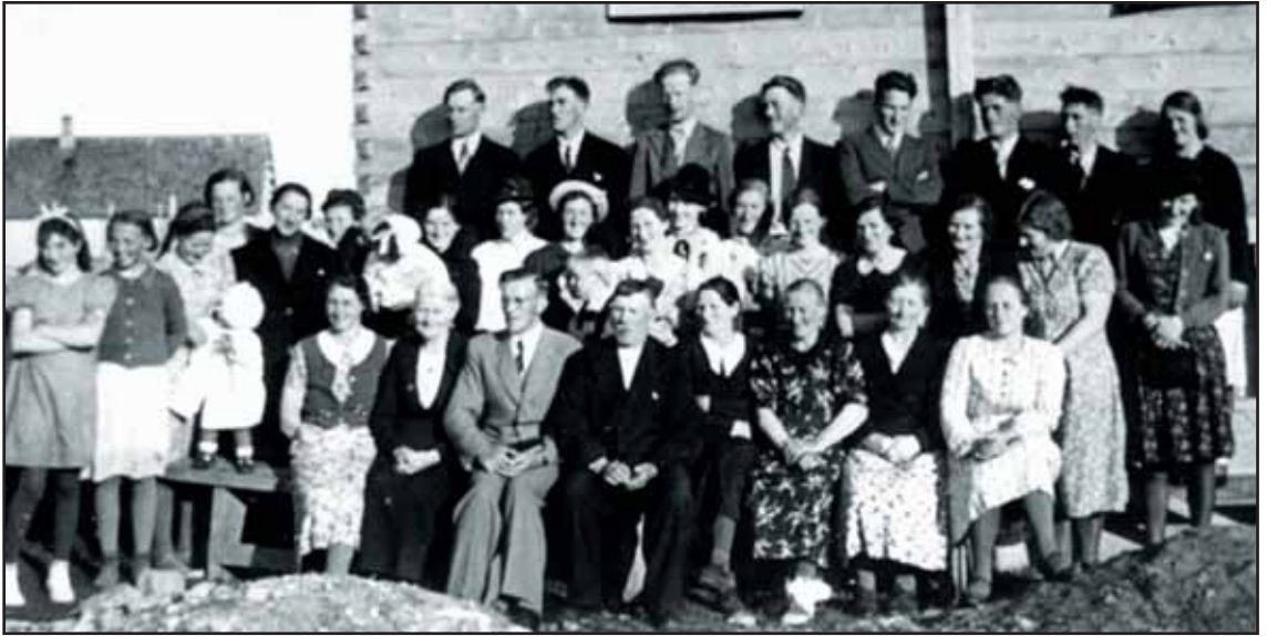
Et av de eldste bildene vi har av Pinsemenigheten på Værøy.