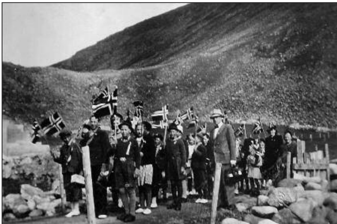
Bildet viser 17.maitoget klar til start i Breivika. Vi vet dessverre ikke årstallet.