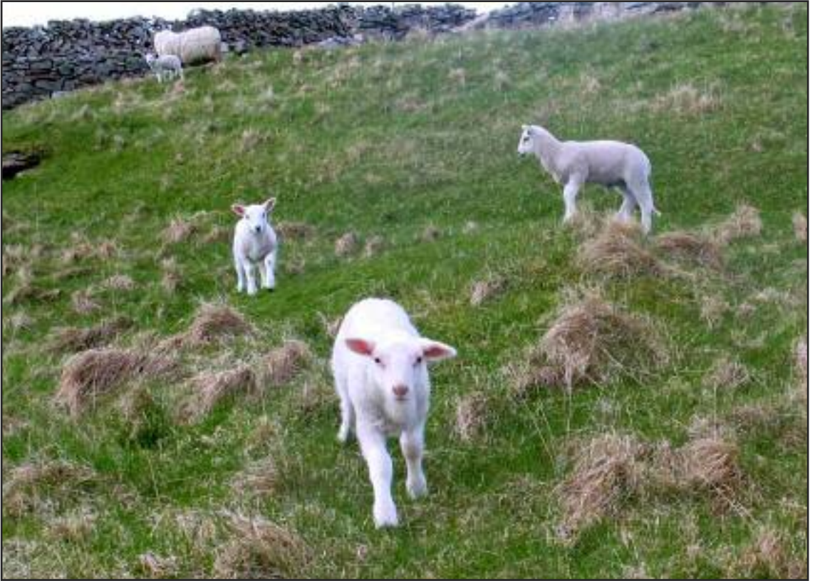
Lekne lam – et sikkert vårtegn.