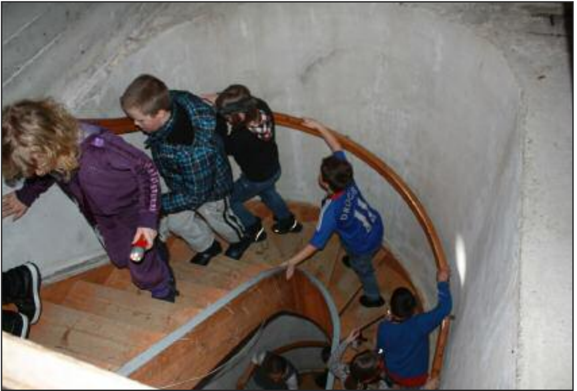
På spennende kveldstur opp til klokketårnet.