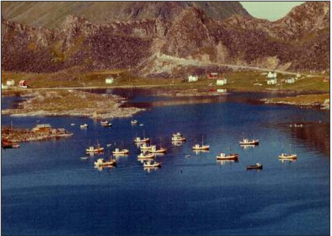
Mange vil nok nikke gjenkjennende til dette bildet som viser en del av fiskeflåten på indre del av Værøy havn. Bildet er fra 1962.